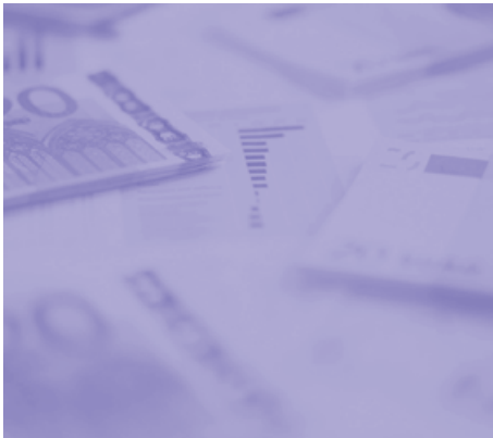
■外国為替証拠金取引業の受入手数料